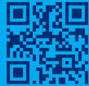
IMAGE PROCESSING AND COMPUTER VISION MSC (IPCV MSC)