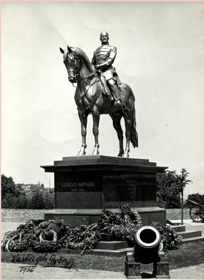
Az eredeti lovas szobor (1935)