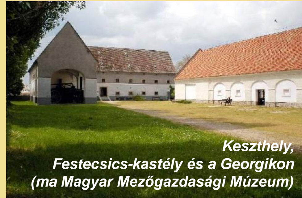
Keszthely, Festecsics-kastély és a Georgikon (ma Magyar Mezőgazdasági Múzeum)